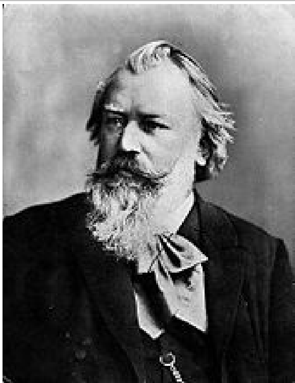
Johannes Brahms (1833 - 1897)